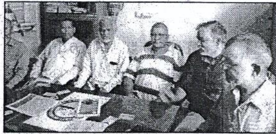
बैठक में मौजूद वामदलों के नेता।

बैठक में वक्ताओं ने कहा कि डबल इंजन सरकार हर क्षेत्र में विफल साबित हुई है। अपनी विफलता को छिपाने के लिए सांप्रदायिक तनाव फैलाकर आपसी सद्भाव बिगाड़ने का कार्य कर रही है। पुरोला से लेकर सहसपुर तथा राज्य में अनेक घटनाएं इसकी मिसाल हैं। उन्होंने कहा कि राज्य में भयंकर आपदा के लिए सरकार की लापरवाही के साथ अनियोजित विकास जिम्मेदार है। आपदा प्रभावितों को तत्काल समुचित मुआवजा दिया जाना चाहिए। वक्ताओं ने कहा वाममोर्चा भाजपा सरकार की सांप्रदायिक एवं जनविरोधी नीतियों के खिलाफ अभियान चलाएगा। इसके तहत राज्य में प्रदर्शन, धरना व सेमिनारों का आयोजन किया जाएगा। वक्ताओं ने बागेश्वर में बेरोजगार संघ के