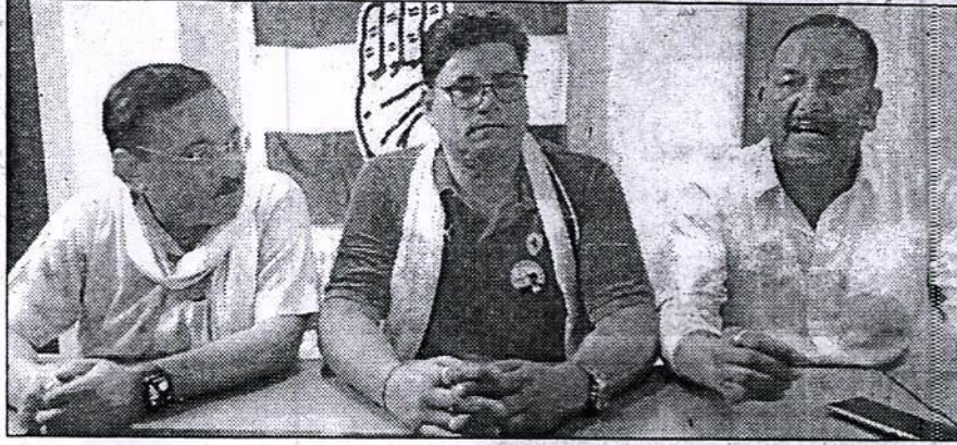
बागेश्वर : पत्रकारों से बातचीत करते कांग्रेस नेता।

बागनाथ मंदिर के दर्शन करते समय किया गिरफ्तार, कांग्रेस की तीखी प्रतिक्रिया, कई गंभीर आरोप लगाए