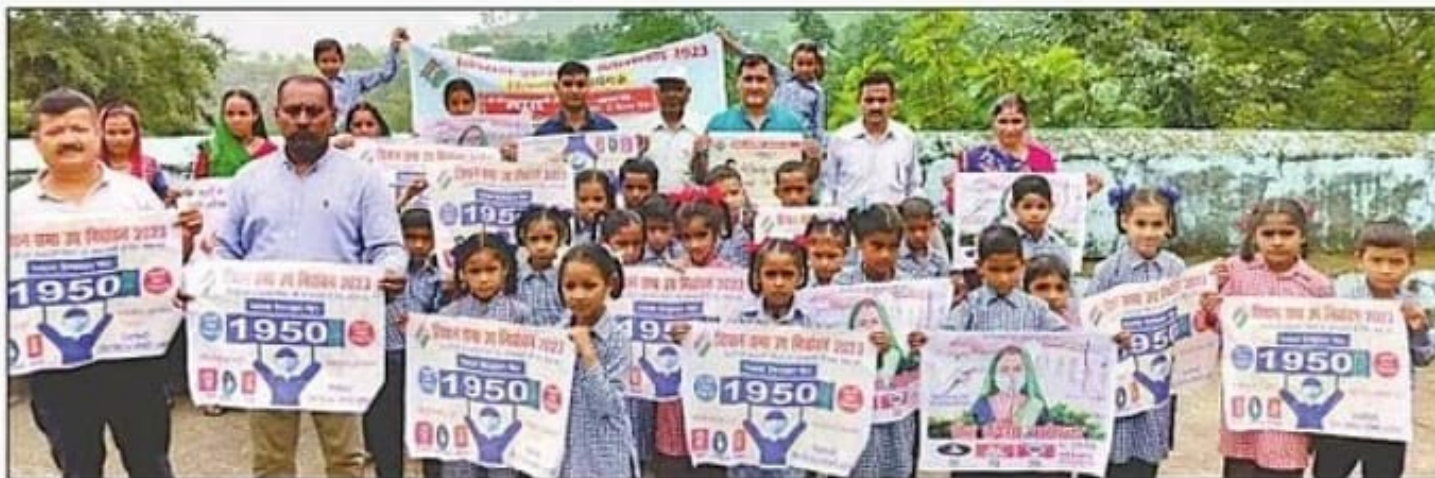
गरुड़ के सुदूरवर्ती गैरलेख में स्वीप की टीम का मतदातन जागरूकता अभियान। संवाद