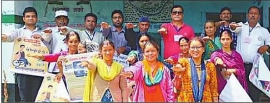
बागेश्वर के मैंगड़ीस्टेट में मतदान की शपथ लेते ग्रामीण।