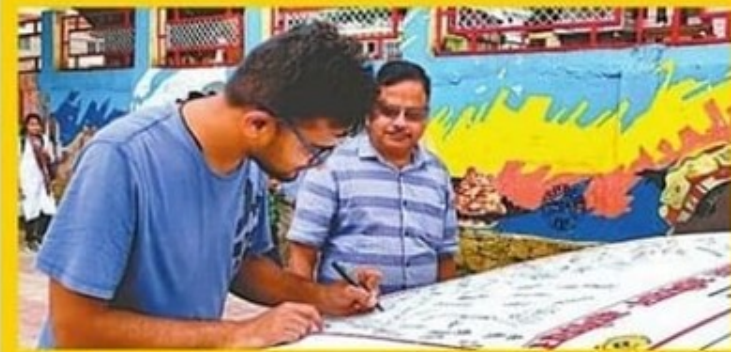
बागेश्वर के नुमाइशखेत मार्ग पर हस्ताक्षर अभियान चलाते स्वीप के सदस्य।