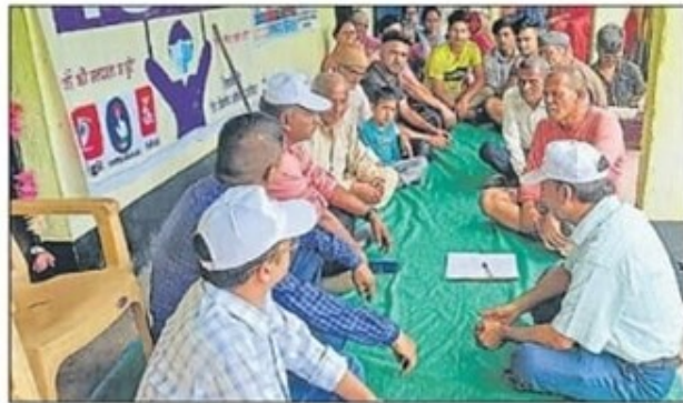
गरुड़ के कुलसारी गांव के लोगों के साथ बैठक करती स्वीप की टीम। • हिन्दुस्तान

12 सौ की आबादी हो रही प्रभावित सड़क न होने से