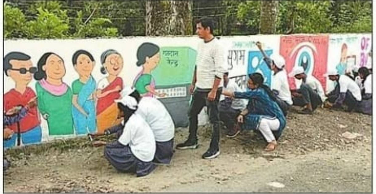
बागेश्वर के राइंका वज्यूला में वॉल पेंटिंग करते विद्यार्थी।