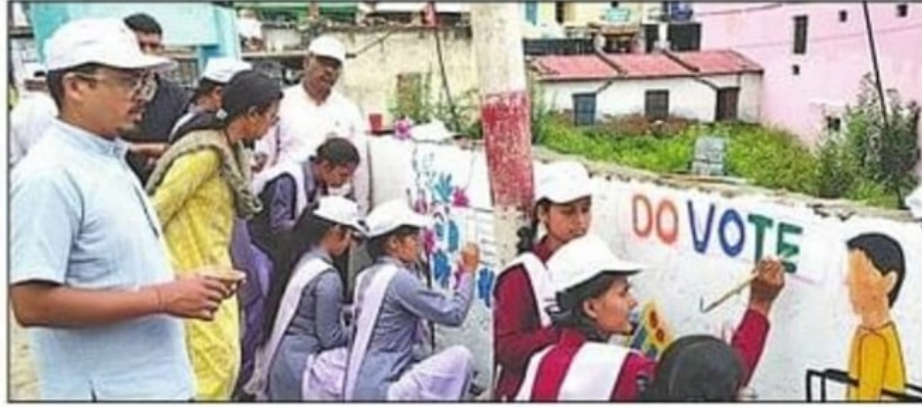
बागेश्वर के राइंका गरुड़ में वॉल पेंटिंग करते विद्यार्थी।