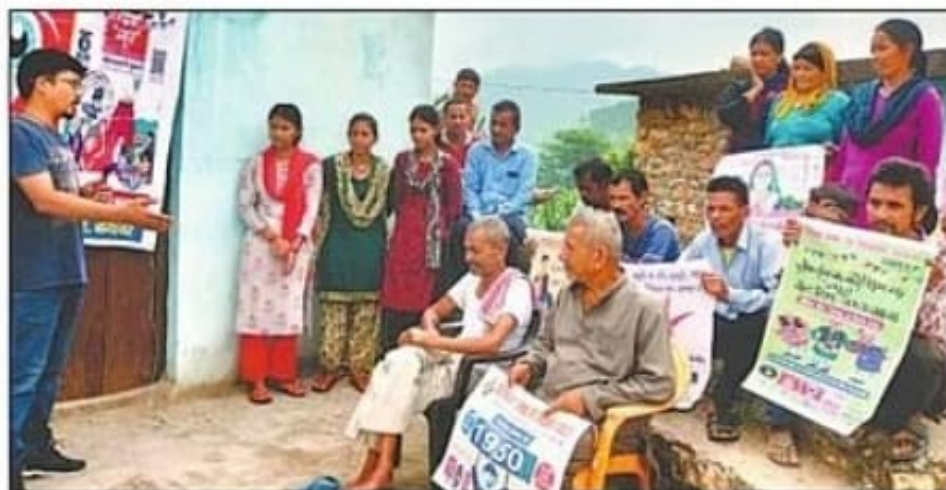
लोगों को मतदान के लिए प्रेरित करती स्वीप टीम।